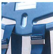
腿ベルト用フック使用例