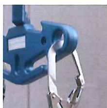
二丁掛フック用穴使用例