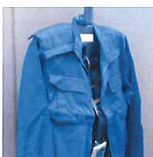
上着等も掛けられます