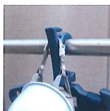
ヘルメット用フック使用例